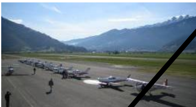
Bild links: Samstag, 27. April 2005 – Ein historischer Tag - Start zu unserer allerersten UL TOUR ITALY.

Liebe Zeller UL-Freunde, liebe Interessenten an der UL TOUR ITALY 2012, liebe Fliegerfreunde!